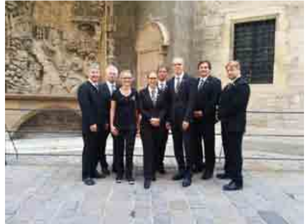
Das Team der Bestattung UNVERGESSEN steht Ihnen in der Gemeinde Wienerwald zur Verfügung

Plötzlich hat man das Gefühl, diese Liebe nicht mehr erwidern zu können. Gerade deshalb ist es uns von der Bestattung UNVERGESSEN besonders wichtig, dass die Hinterbliebenen die Möglichkeit haben, ihre Gefühle noch einmal zu zeigen. Eine entsprechend individuelle Verabschiedung ist Teil eines liebevollen „Lebewohls“.