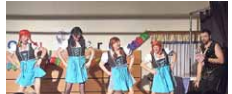
Auch Andreas Gabalier kam vorbei

Spaß an der Sache macht, kann es nur gut werden!