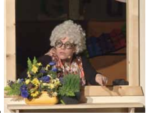
Die Gruaberin - ihrem Blick entgeht nichts

Spaß an der Sache macht, kann es nur gut werden!