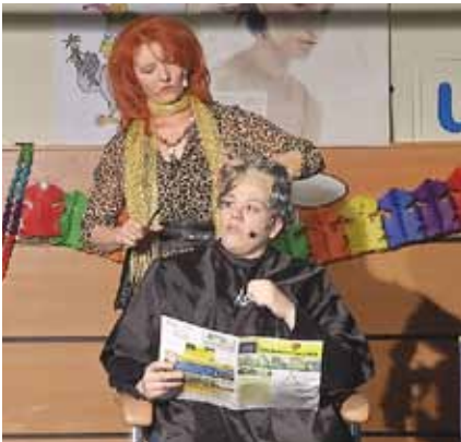
Beim Friseur - die Verwechslung

Stunden mit großem Aufwand, aber auch Zusammenhalt dieses erfolgreiche Projekt auf die Beine gestellt. Schon bei den Proben gab es so viel Spaß, dass alle versicherten, wieder