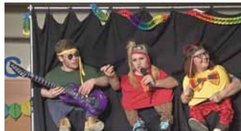
Die Gruber Zwergerln

dabei sein zu wollen. Das Rezept für den Erfolg: Wenn man etwas mit viel Liebe und