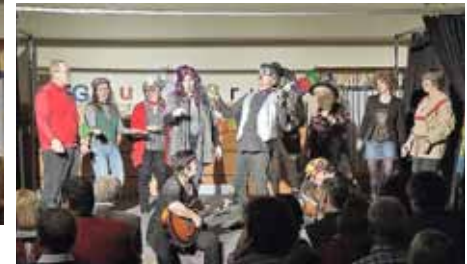
Lied- Sie brauchen nur den Nippel durch die Lasche ziehn ...

All jene, die keine Möglichkeit hatten, sich das anzuschauen, haben wirklich etwas versäumt. Aber, wer weiß - vielleicht gibt es ja ein nächstes Mal?