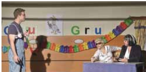
GSDS - Grub sucht den Superstar!

dabei sein zu wollen. Das Rezept für den Erfolg: Wenn man etwas mit viel Liebe und