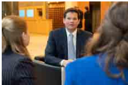
Es ist eine Freude, für unsere Landsleute da sein zu dürfen. Da geht es um unsere Anliegen und Interessen."

Die EU-Kommission hatte für richtige Ziele falsche Maßnahmen vorgeschlagen. Die richtigen Ziele waren ein EU-Katastrophenschutz für echte Großkatastrophen und sauberes Trinkwasser für alle in Europa. Die falschen Vorschläge waren Kommerzialisierung und Zentralisierung der Feuerwehr- und Rettungsdienste sowie teure Extra-Regulierung für un-