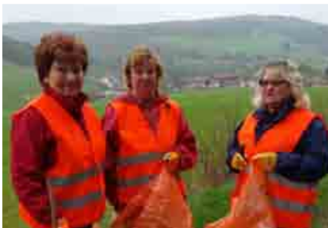
( 3 Damen aus Dornbach)

Ganz besonders möchte ich mich bei unseren Senioren bedanken, die in vielen Stunden die Straßenränder von all dem achtlos weggeworfenen Müll reinigen. Es ist eine Schande, wie manche Mitbürger und Gäste unserer Gemeinde sich ihres Abfalls entledigen.