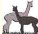
Alpakawolle u - produkte

Kaiserbrunnstraße 65 3021 Pressbaum Tel.: 699/13834494 info@alles-alpaka.at www.alles-alpaka.at